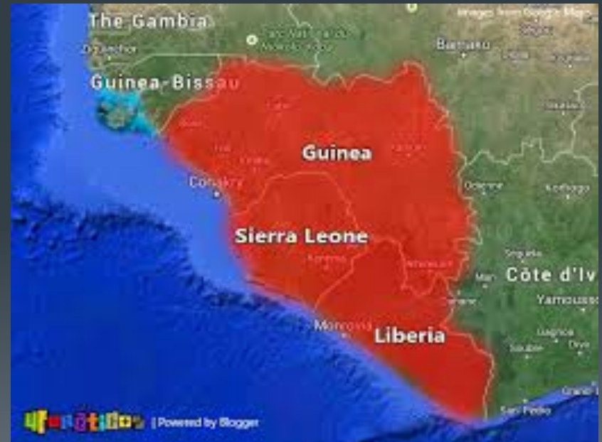
Países do Ebola